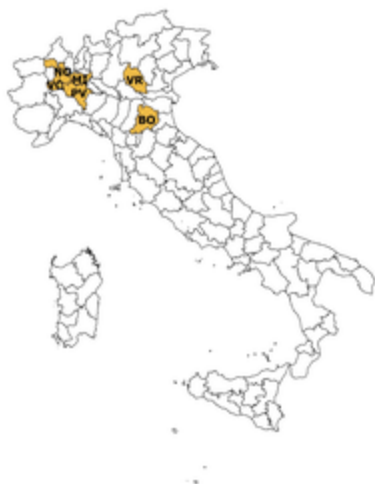
la rete di rilevazione Ismea